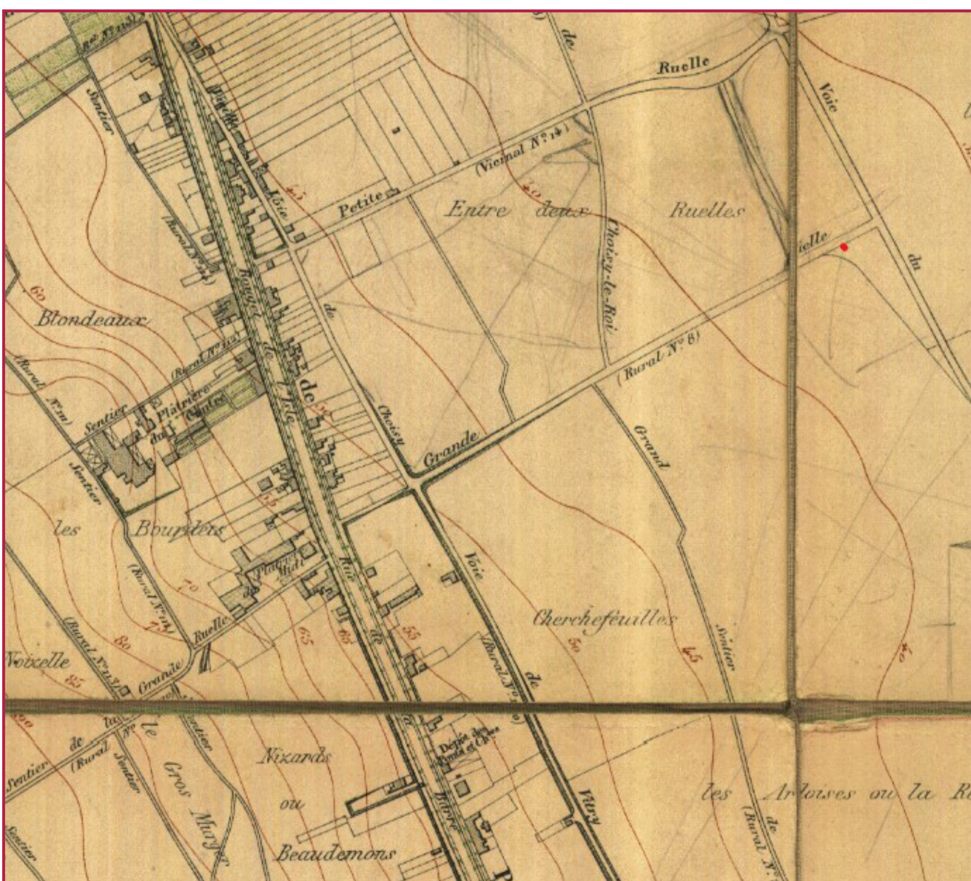
Extrait du plan de Vitry-sur-Seine vers 1900.

Au terme de l'exploitation, les excavations devaient être bouchées et parfaitement nivelées. Le terrain devait être rendu propre à la culture étant entendu que la terre végétale d'origine, ayant été mise en réserve, devait être replacée sur la partie exploitée.